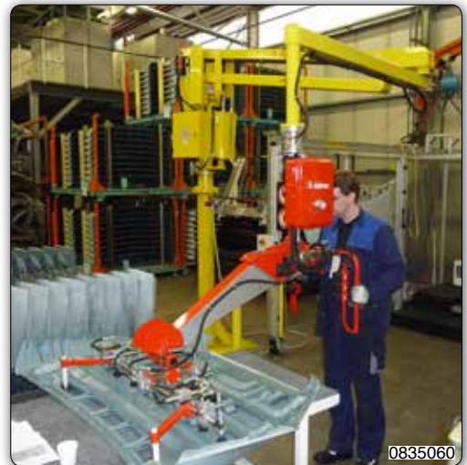
Manipulateur Partner sur colonne pour la manipulation de carters moteur.