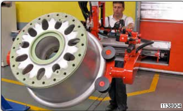
Manipulateur Micropartner équipé d'un outil à pince pneumatique, avec inclinaison pneumatique, adapté à la manipulation de moyeux en asservissement d'une machine outil.