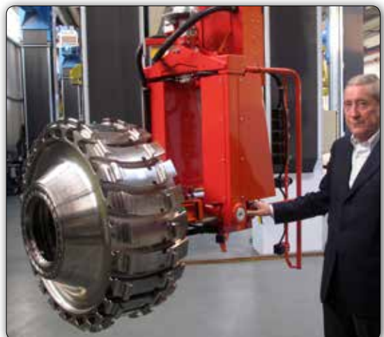
Outil de préhension pour le chargement et le déchargement d'éléments des turbines d'avion, avec inclinaison pneumatique.