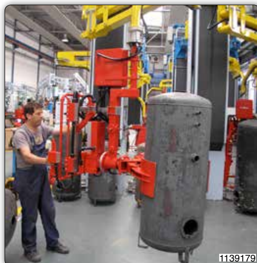
Manipulateur Maxipartner type MXC sur colonne avec outil de préhension à pince pneumatique pour le transfert de pièces mécaniques de palette à machine-outil. La colonne est montée sur base roulante motorisée.