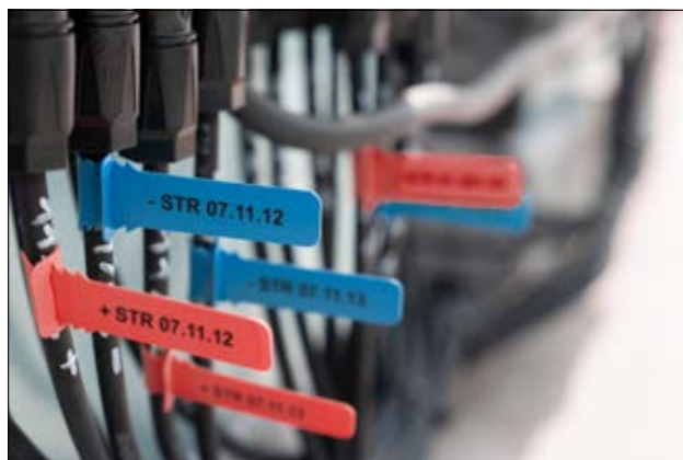
TAGPU - Repère d'identification de câble