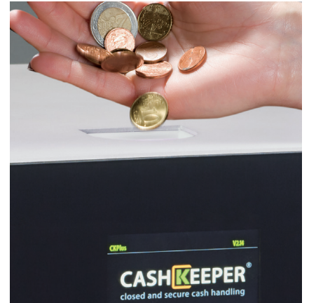
Accepte, valide, recycle et paie toutes les pièces