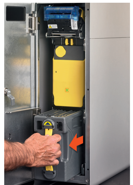
Collecte de billets dans un module fermé. Personne ne voit ni touche l'argent