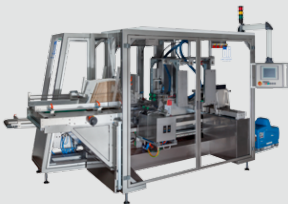
Plan d'ensemble oli 310 avec olimat 3D

Remarque: Les machines d'emballage oli sont personnalisées en termes de cadence, de couleur, de charge installée, etc., pour répondre à l'application spécifique du client. Toutes les machines peuvent être conçues en fonction de chaque format.